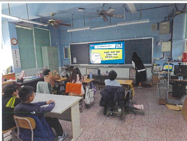
親子天下：反毒大富翁