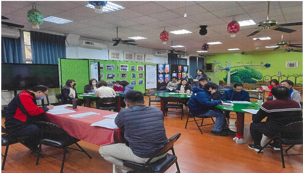
2-3 學校每學期開學 3 週內召開特定人員審查會議並建立特定人員名冊